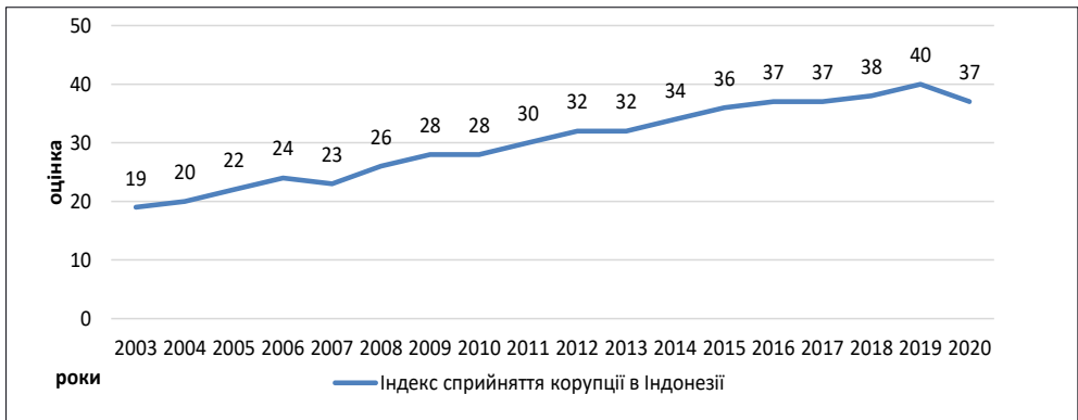
Рис. 1. Індекс сприйняття корупції в Індонезії (2003-2020 роки)

Джерело: розроблено автором, на основі Transparency International CORRUPTION PERCEPTIONS INDEX: INDONESIA .